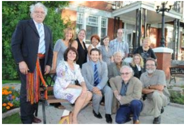
Le comité organisateur en compagnie de politiciens.